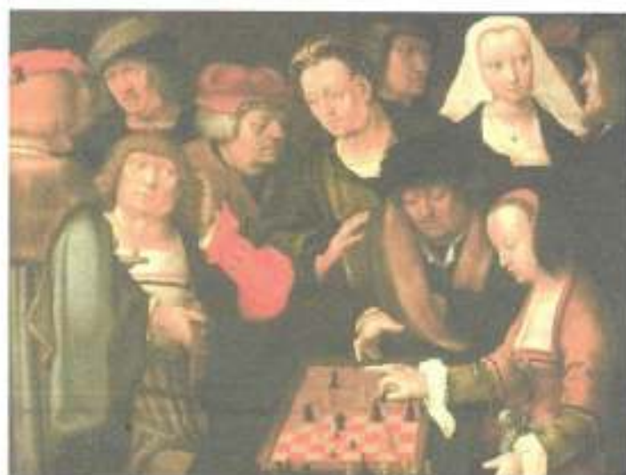
Partita a scacchi di Lucas Van Leyden (Berlino, Gemaeldegalerie)