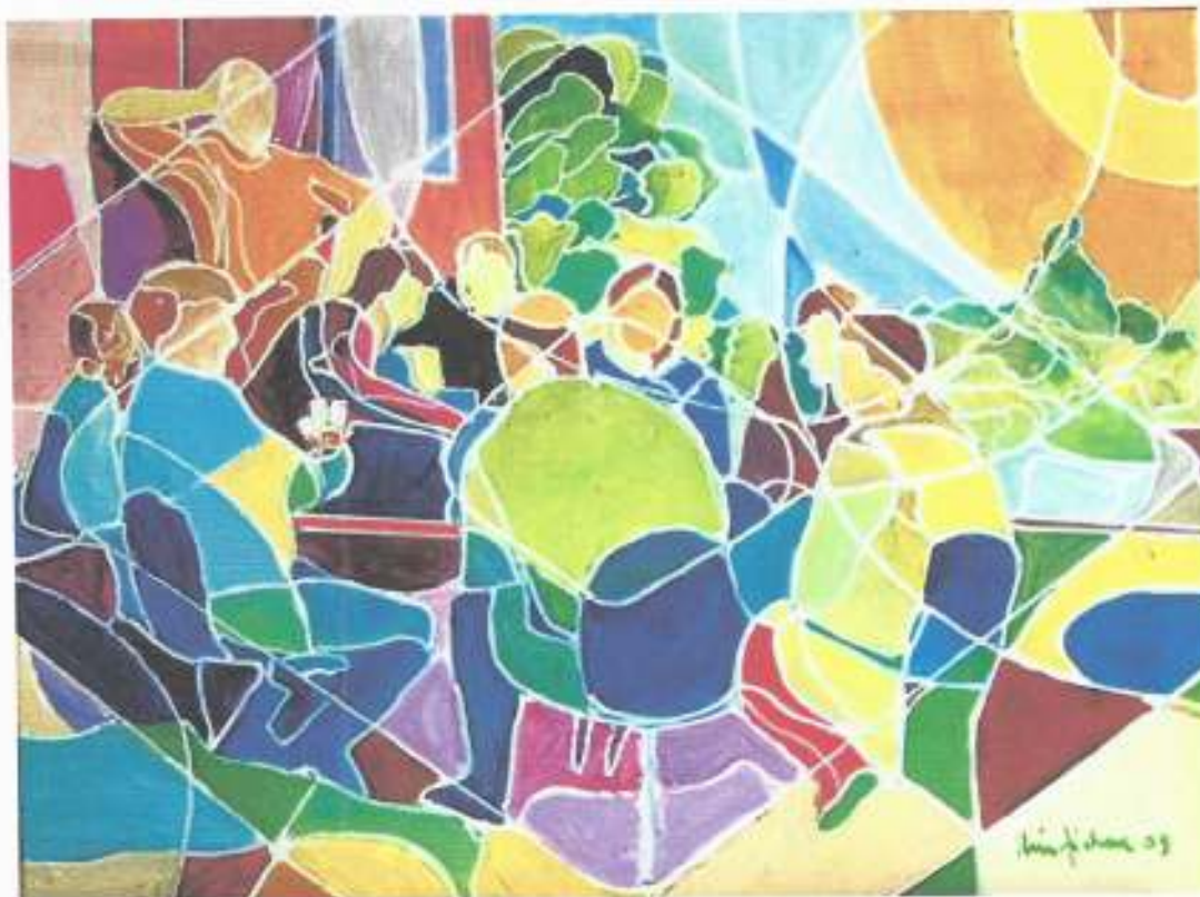
Nino Fichera - I giocatori di carte in un pomeriggio estivo -olio su tela 80x60 cm - (2009)